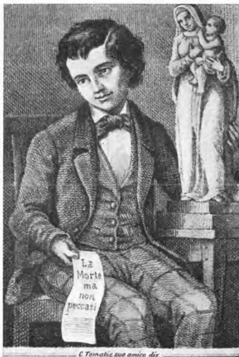
Il disegno originale dell'amico Tomatis che Don Bosco riprodusse nella prima edizione della "Vita di Domenico Savio" del 1858.