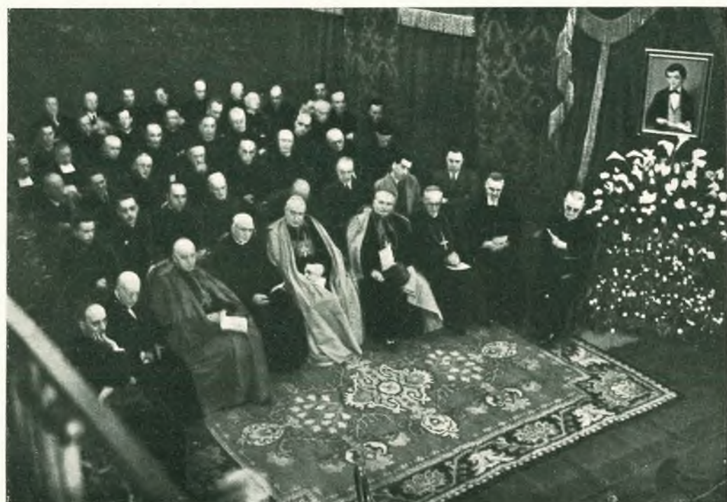
Torino - La commemorazione del centenario della nascita del Ven. Domenico Savio: Autorità e personalità.