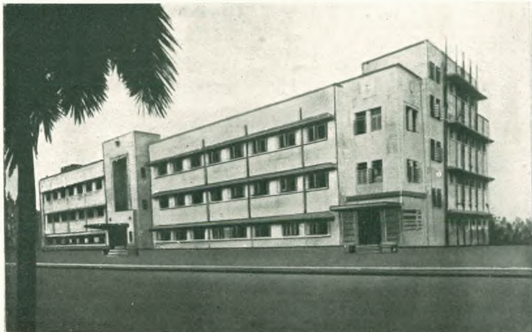
Bombay - Il nuovo padiglione dell'Istituto Salesiano.